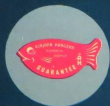
Forsiden af Hørgårds kataloger fra 1963 og 1964.

Sølvkroken lever i bedste velgående den dag i dag og har hovedkontor i Arendal på Sørlandet. Men helt så norsk som Hørgård var, er det jo ikke.