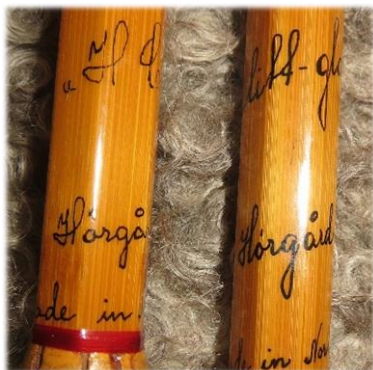
Bambus var Hørgårds foretrukne stangmateriale helt op til 1980'erne. Her små detaljer på to splitcanestænger fra halvtredserne og firserne. Man kan ikke sige Hørgård uden også at sige splitcane.

ham i 1934, at fremstille sin første splitcanestang af gamle bambuskistave med en maskine, han havde opfundet, som med dele fra en cykel kunne høvle trekantede tonkinsplitter!