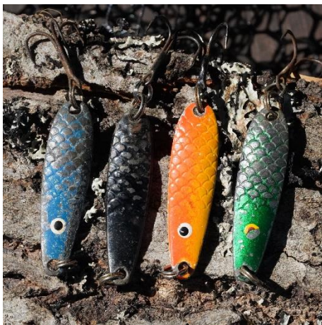
Thomas på 7 gram.